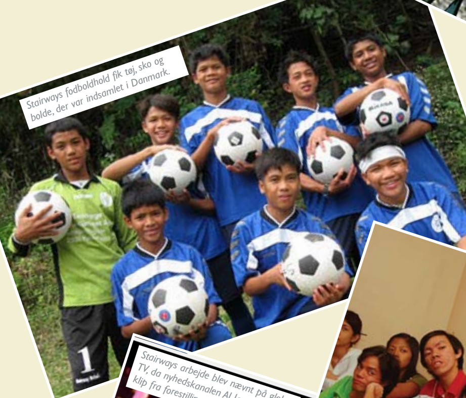
Stairways fodboldhold fik tøj, sko og bolde, der var indsamlet i Danmark.