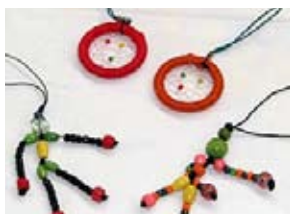
Mobilvedhæng i perler og flet: 20 kr.