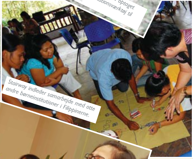
Stairway indleder samarbejde med otte andre børneinstitutioner i Filippinerne.