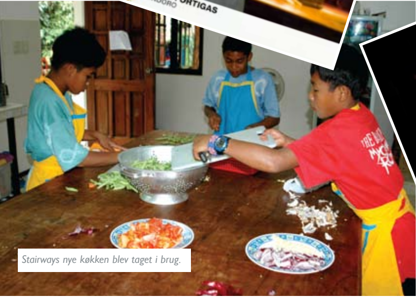
Stairways nye køkken blev taget i brug.