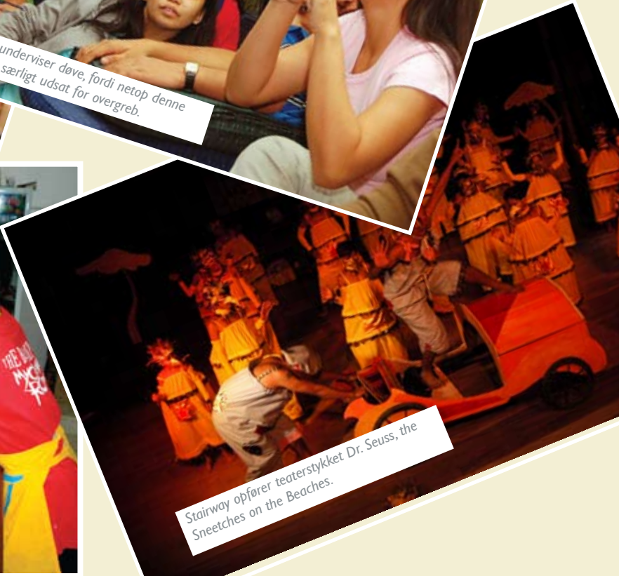
Stairway opfører teaterstykket Dr. Seuss, the Sneetches on the Beaches.