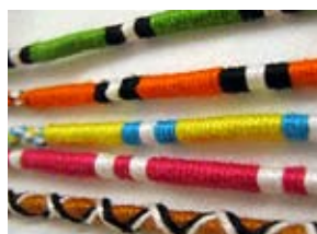
Knyttede armbånd: 10 kr.