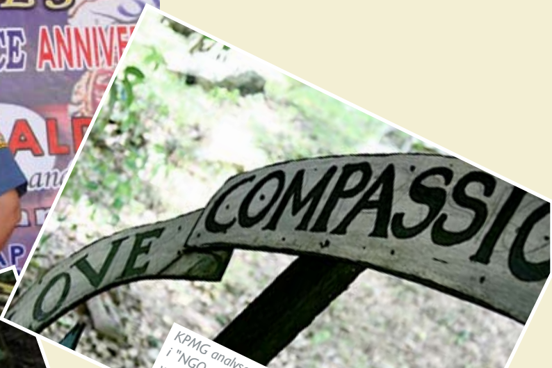
KPMG analyserede Stairway, og vi blev optaget i "NGO-profilen" - et dokumentationsværktøj til vores indsamlingsarbejde.