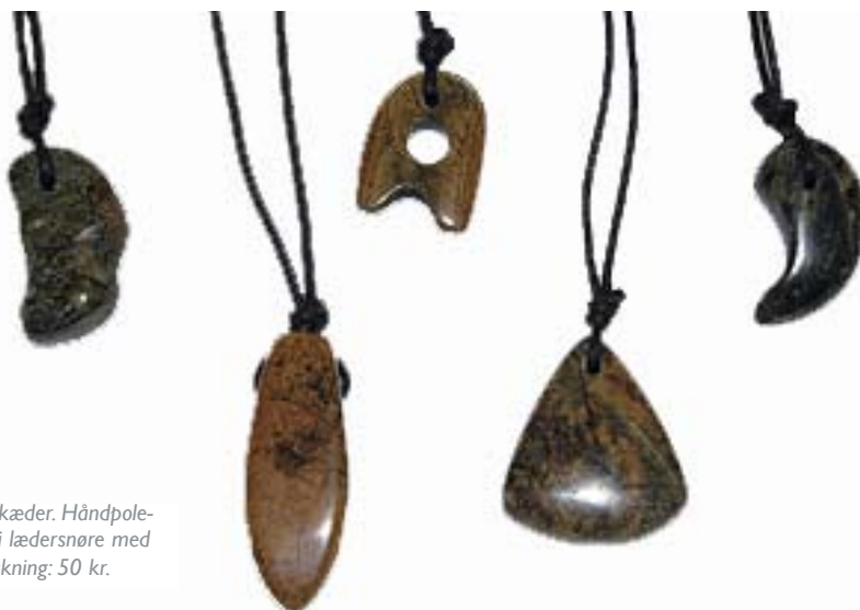
Flotte halskæder. Håndpole-rede sten i lædersnøre med universallukning: 50 kr.

Gå en tur i butikken på www.stairwaydanmark.dk - alle indtægter går ubeskåret til gadebørnscentret i Filippinerne.