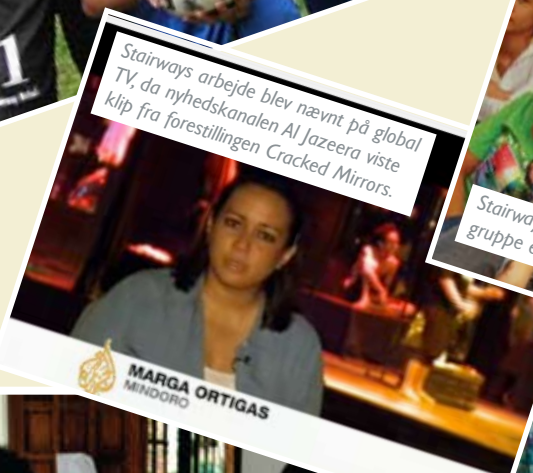
Stairways arbejde blev nævnt på global TV, da nyhedskanalen Al Jazeera viste klip fra forestillingen Cracked Mirrors.