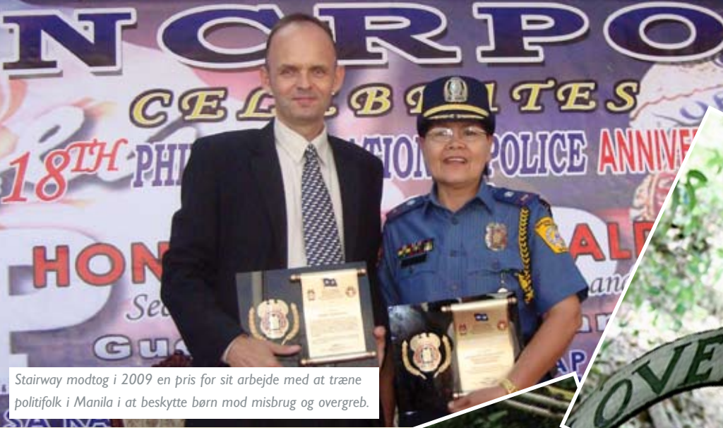
Stairway modtog i 2009 en pris for sit arbejde med at træne politifolk i Manila i at beskytte børn mod misbrug og overgreb.