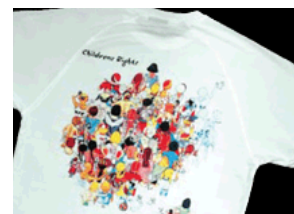
T-shirts med motiv af Sophie Jo: 75 kr.