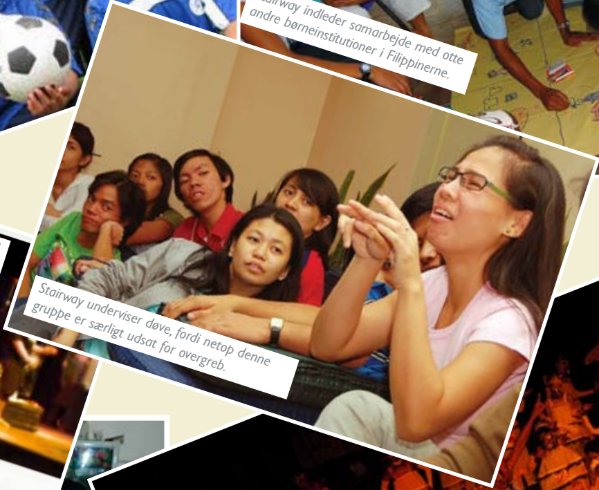
Stairway underviser døve, fordi netop denne gruppe er særligt udsat for overgreb.