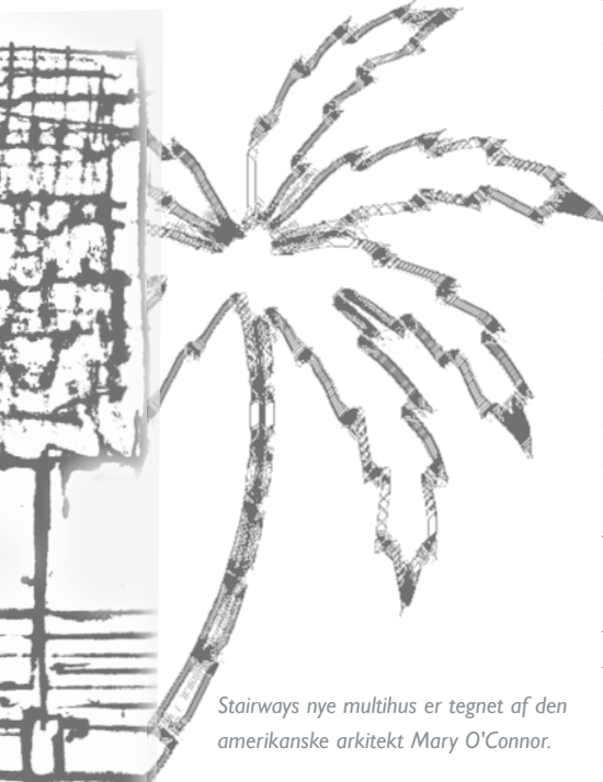
Stairways nye multihus er tegnet af den amerikanske arkitekt Mary O'Connor.

Alt arbejde i foreningen Stairway Danmark er frivilligt og ulønnet. Vores udgifter til tryk af nyhedsbrev, porto og transport dækkes af sponsorbidrag fra virksomheder og via et fast tilskud fra Tipsmidlerne. Alle private bidrag til Stairway Danmark går derfor ubeskåret til arbejdet med børn og unge i Filippinerne.